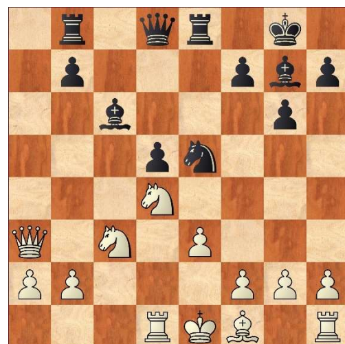
Littel - Van Velden, na 15. Tc1-d1

De ontwikkelingsvoorsprong van zwart valt meteen op. Ziet u hoe het nu verder moet?